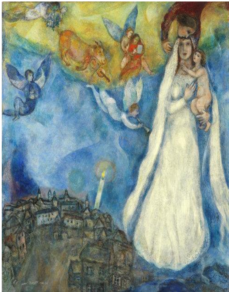
Marc Chagall, Madonna of the Village, 1942

SĂRBĂTORI FERICITE și LA MULȚI ANI 2021!