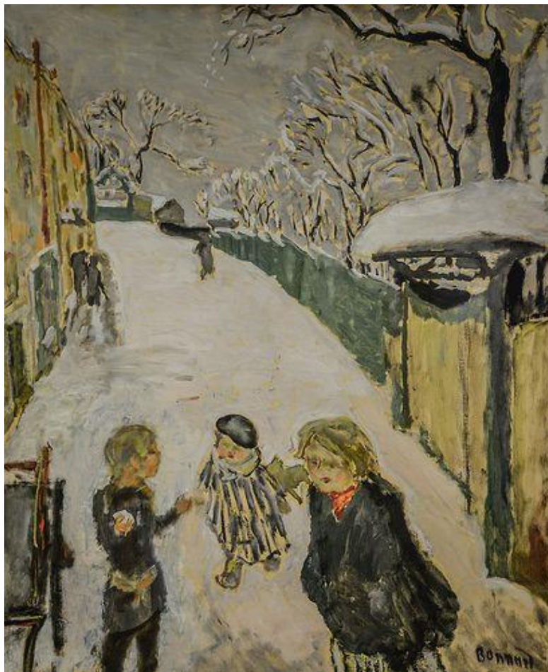
Pierre Bonnard: Jeux d'enfants dans la neige/La Rue , 1907

SĂRBĂTORI FERICITE și LA MULȚI ANI 2022!