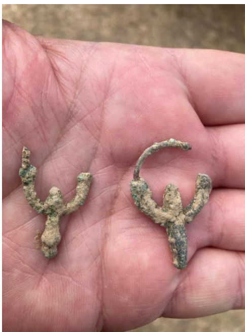
Descoperire din campania arheologică de la Capidava, iulie 2022

Ca în fiecare an, în luna iulie s-a desfășurat campania de cercetări arheologice din ansamblul Capidava – cetate (unul dintre cele mai vechi șantiere arheologice din România, prima campanie fiind în 1924) și „șantier școală” – pe care studenți ai mai multor universități deprind tainele arheologiei. Din anul 2002, institutul nostru a devenit partener al amplului colectiv de cercetare ce cuprinde Universitatea București, Universitatea „Ovidius” din Constanța,